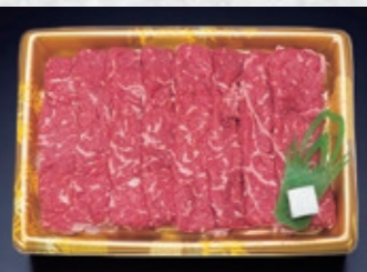
※写真は400gの商品イメージです。