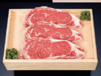
※写真は3枚の商品イメージです。